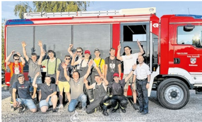
Einige Kameraden aus Wallhausen konnten im Sommer das Leistungsabzeichen in Bronze ablegen.

Ein Zimmerbrand musste durch einen ausgelösten Heimrauchmelder befürchtet werden. Da