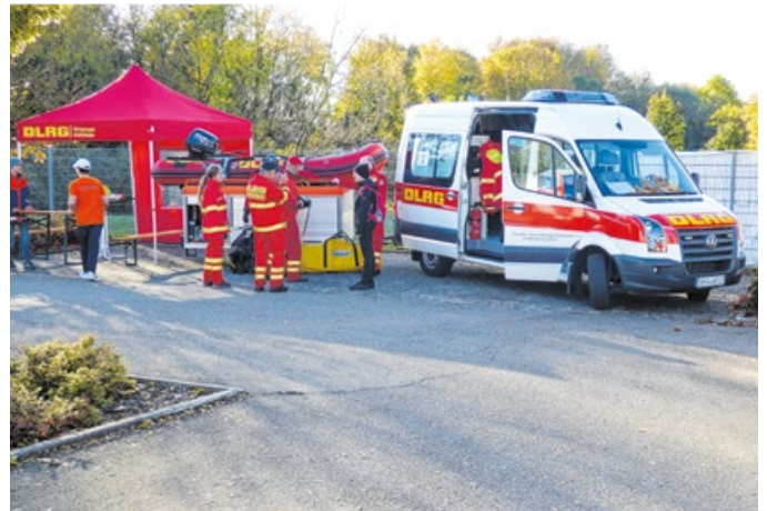
Bei der Jubiläumsfeier stellten zahlreiche Hilfsorganisationen, darunter auch die DLRG, ihre Arbeit vor.

Das Highlight der Jubiläumsfeier war die Meile der Hilfsorganisationen. Hier konnten sich die Gäste einen Überblick über die Arbeit in den verschiedenen Organisationen verschaffen. Mit dabei waren unter anderem das Technische Hilfswerk (THW), die Deutsche Lebensrettungsgesellschaft (DLRG), der Arbeiter-Samariter-Bund, der Malteser Hilfsdienst und das Krisen-Interventionsteam. Organisiert wurde das gelungene Fest von