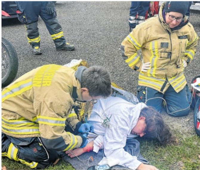
Acht Kameradinnen und Kameraden aus Gerabronn haben 2023 die zeitaufwändige Sanitäter-Ausbildung absolviert.

Im Sommer hatte die Gerabronner Feuerwehr dann mit verhältnismäßig vielen klimabe-