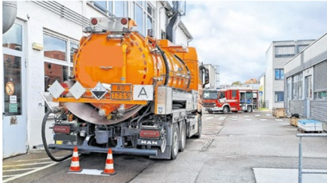
Es fanden auch Übungen bei Gefahrgutaustritt statt.

Neben diesem auch mit baulichem Aufwand betriebenen Umbau standen viele Übungsdienste und Einsätze an. Diese Übungen finden ganztägig statt und werden von der Mannschaft gut angenommen. Durch die verfügbare Zeit können die einzelnen Übungen intensiviert und bei Bedarf auch wiederholt werden. Die Sanitäter der Werkfeuer-