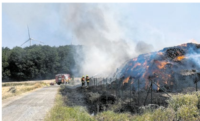
In Jungholzhausen brannte ein 20 Hektar großer Strohhaufen. Das Feuer wurde aufwändig gelöscht.

Die Nachlöscharbeiten zogen sich bis nach Mitternacht hin. Es wurde eine lange Löschwasserstrecke vom Becken im Ort zur Einsatzstelle verlegt. Bagger und Radlader wurden angefordert, der Maschinenring unterstützte die Kameraden mit vier Zubringerfässern von je 26 Kubikmeter. So wurden etwa 700 Kubikmeter