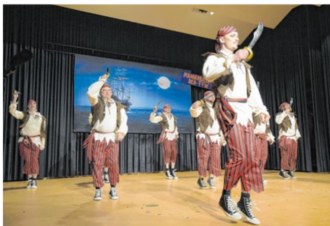
15 Tänzer zwischen 23 und 60 Jahren bilden das Männerballett. Beim Programmfasching haben sie ihren großen Auftritt.

15 Tänzer im Alter zwischen 23 und 60 Jahren treffen sich in den Monaten vor Fasching und trainieren fleißig für ihren Auftritt. Einstudiert wird der Tanz