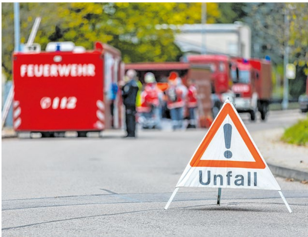
Wenn es zu einem Unfall kommt, zählt schnelle Hilfe durch die Einsatzkräfte. Neue Techniken in den Pkw unterstützen dabei ganz automatisch.

Geht der E-Call aus dem Unfallfahrzeug an die herstellereigene Leitstelle, liegen dort mitunter noch weitere wichtige Hinweise vor: „Zum Beispiel haben die Zuständigen vor Ort Zugriff auf Kundendaten. Das ist besonders wichtig, wenn die Insassen nicht mehr ansprechbar sind.“ Ebenso die Unfallschwere, die Aufprall-Position sowie der Straßentyp können herausgefiltert werden, um damit gezielt die dem Unfallort nächstgelegene Rettungsleitstelle zu alarmieren, die daraufhin die Rettungsmaßnahmen einleitet. „Zudem kommunizieren die erweiterten Hersteller-Notrufzentralen immer in der im Fahrzeug voreingestellten Landessprache, was besonders im Ausland die Kommuni-