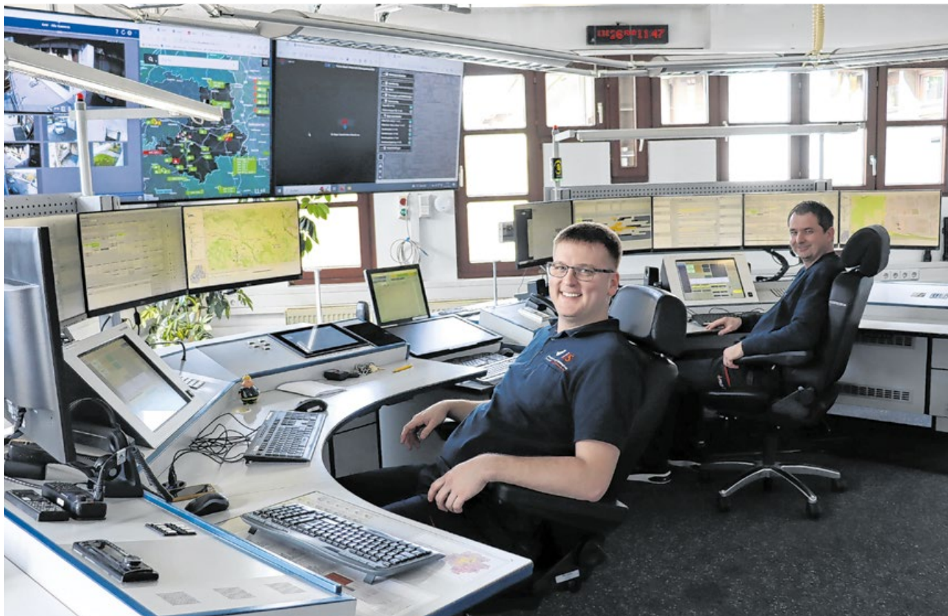
Blick hinter die Kulissen: So sieht es innerhalb der Integrierten Leitstelle in Schwäbisch Hall aus.