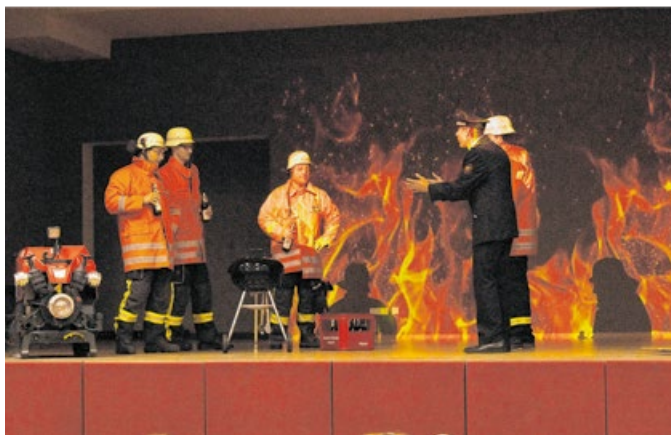
Jede Abteilung hatte ihren großen Auftritt.

Dann hieß es für die Gäste „Essen fassen“. Im Anschluss daran durfte jede Abteilung eine Darbietung zum Besten geben. Die Jugendfeuerwehr legte mit