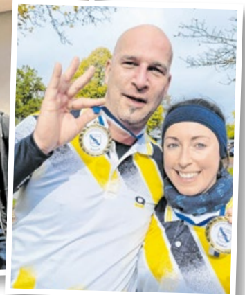
Das Feuerwehr-Fußballturnier und die Teilnahme an Laufevents sind die sportlichen Highlights für die FF Michelbach.

dem Hohenlohekreis oder dem Rems-Murr-Kreis. Die weiteste Anreise hatten in den vergangenen Jahren die Jugendfeuerwehr aus Weißkollm aus dem Landkreis Bautzen in Sachsen sowie die Feuerwehr Eppstein-Vockenhäuser aus dem Main-Taunus-Kreis in Hessen.