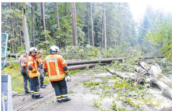
Zahlreiche Bäume knickten bei einem heftigen Unwetter im Gemeindegebiet um.

Am 8. Juni wurde Bühlerzell von einem Unwetter mit Starkregen und Hagel innerhalb weniger Minuten zweimal getroffen. Die Folge waren herausgespülte Kanaldeckel, vollgelaufene Keller und Schlammlawinen, die von Äckern abgingen. Zahlreiche Einsatzorte und stundenlange Aufräumarbeiten waren die Folge. Auch am späten Nachmittag des 24. August wurde das gesam-