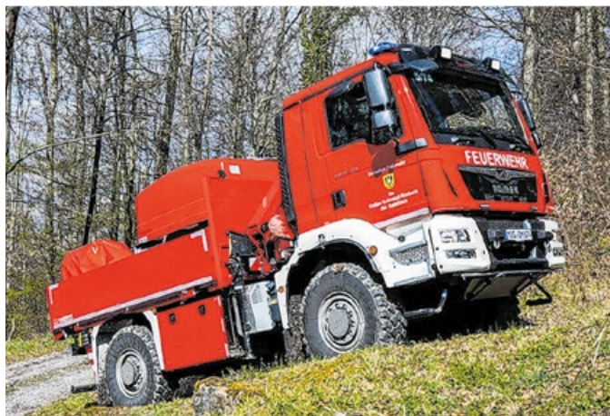
Vier solcher Gerätewagen Logistik Katastrophenschutz, kurz „GW-L KatS Waldbrand“, werden für den Einsatz im Landkreis beschafft.

Vier solcher Fahrzeuge werden demnach nun im Zuge der Etablierung eines Wald- und Vegetationsbrandkonzeptes vom Landkreis gemeinsam mit den