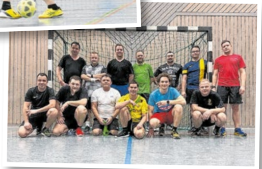
Aus der Sportgruppe in Oberrot ist gleich eine eigene Abteilung entstanden. Die Kameraden trainieren zusammen mit Feuerwehrleuten aus Fichtenberg – am liebsten wird Fußball gespielt.