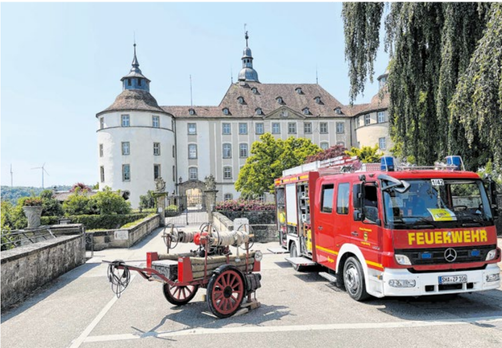
Ein Training in ganz besonderer Atmosphäre erlebten die Feuerwehrleute aus Langenburg vergangenes Jahr. Sie konnten bei der Übung im Schloss Langenburg ihre Fähigkeiten im Umgang mit den neuen Atemschutzgeräten verbessern.