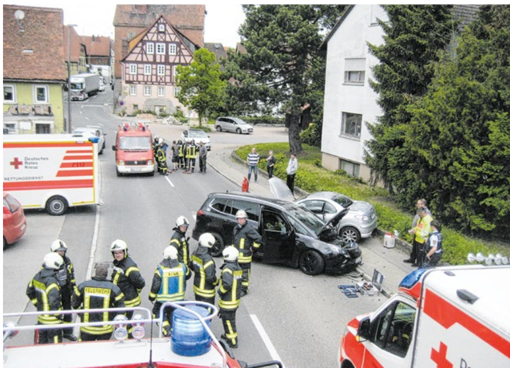
Bei einem Verkehrsunfall in der Ortsmitte von Riedbach im Mai 2023 kamen die Feuerwehrkräfte aus den Abteilungen Schrozberg und Schrozberg-West sowie der Rettungsdienst zur Hilfe.

Auch wenn jede Abteilung in ihrem Bereich selbstständig agiert, und dazu bereits in Leuzendorf und Schrozberg-West jeweils ein wasserführendes Löschfahrzeug stationiert wurde, ist die Zusammenarbeit der Abteilungen immens wichtig. Und so unterstützt nicht nur die Abteilung Schrozberg die anderen Abteilungen, sondern bei bestimmten Alarmstichworten rücken die