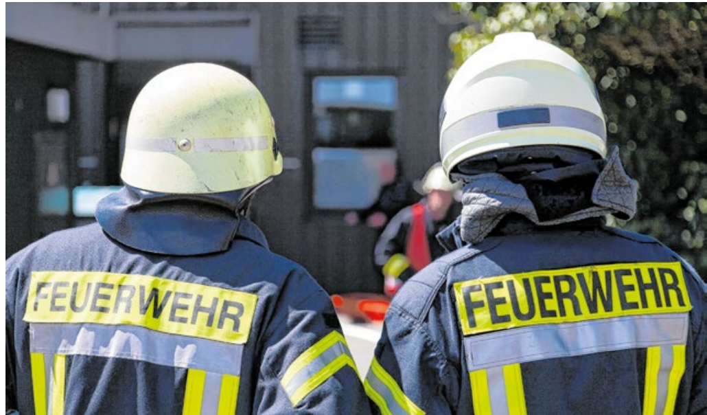
300 Einsätze absolvierte die Feuerwehr Crailsheim.