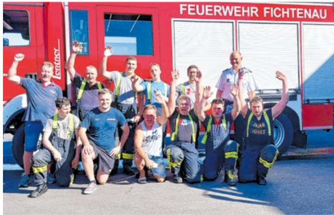
Die Feuerwehr Fichtenau hatte Grund, sich zu freuen.

Im Juli wurde die Abnahme des Leistungsabzeichens des Landkreises Schwäbisch Hall auf dem