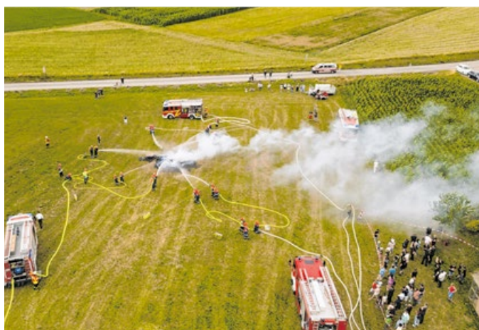
Zum 20. Geburtstag der Jugendfeuerwehr fand auch eine große Übung statt.

Eine besondere Übung fand am 23. September in Obersontheim statt. 100 Einsatzkräfte der Wehren Obersontheim, Bühlertann, Frankenhardt und Bühlertann nahmen teil. Übungsszenario war ein Brand in einem großen Industriebetrieb mit zwölf vermissten Personen, bei dem die Kameradinnen und Kameraden unter teilweise realen Einsatzbe-