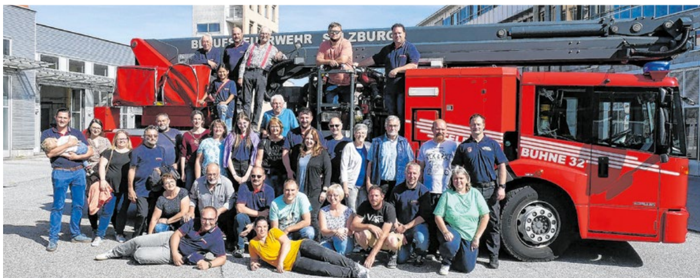
Der Jahresausflug führt die Feuerwehrleute aus Sulzbach-Laufen nach Salzburg. Dabei stand auch die Besichtigung der Hauptfeuerwache der örtlichen Berufsfeuerwehr auf dem Programm.