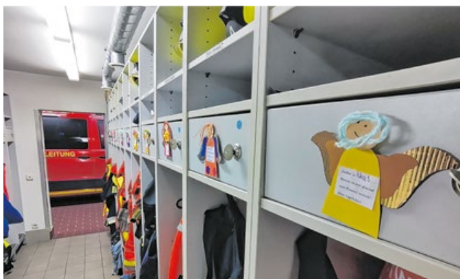
Für ihre Helden der Feuerwehr haben die „Löschifanten“ zu Weihnachten hübsche Engel gebastelt. Sie zieren seither die Spinde der Kameradinnen und Kameraden.