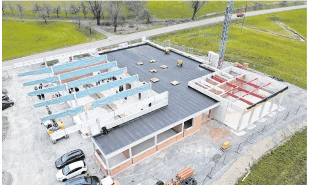
Der Neubau des Feuerwehrmagazins schreitet voran. Im Juli 2024 steht die Einweihung an.

Passend zur neuen Unterkunft gibt es für die Kameradinnen und Kameraden in Zukunft zwei neue Feuerwehrfahrzeuge. Wie im Feuerwehrbedarfsplan