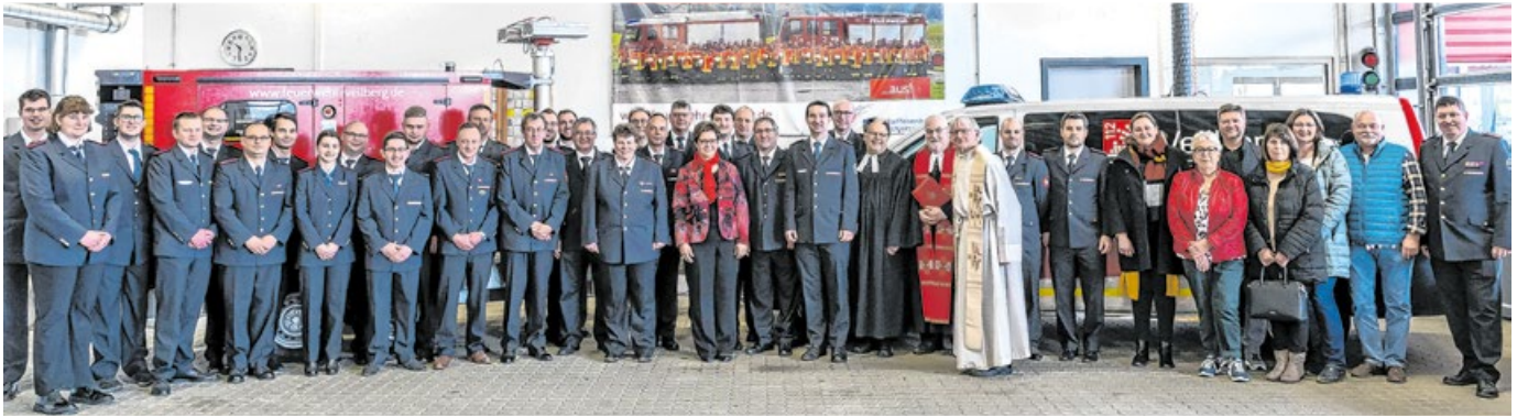
Feuerwehrleute und Vertreter des Gemeinderates kamen zur offiziellen Übergabe der neuen Gerätschaften.