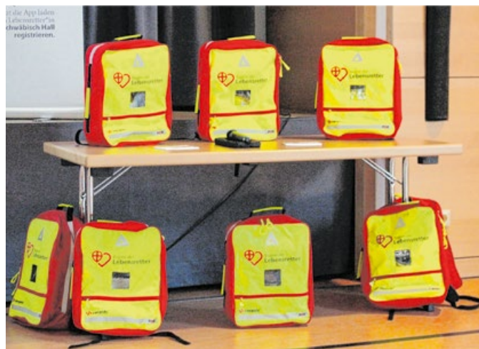
Die registrierten Ersthelfer sollen alle einen sogenannten Rettungsrucksack bekommen. Darin befinden sich nützliche Artikel für den Erste-Hilfe-Einsatz.