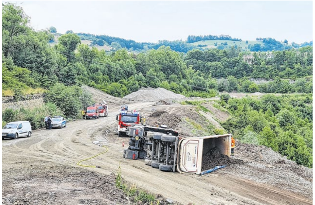
Im Einsatz: Ende Juni kam es im Steinbruch in Michelbach/Bilz zu einem Lkw-Unfall.

Die Anzahl der Einsätze hat sich gegenüber dem Vorjahr leicht reduziert. Insgesamt 17