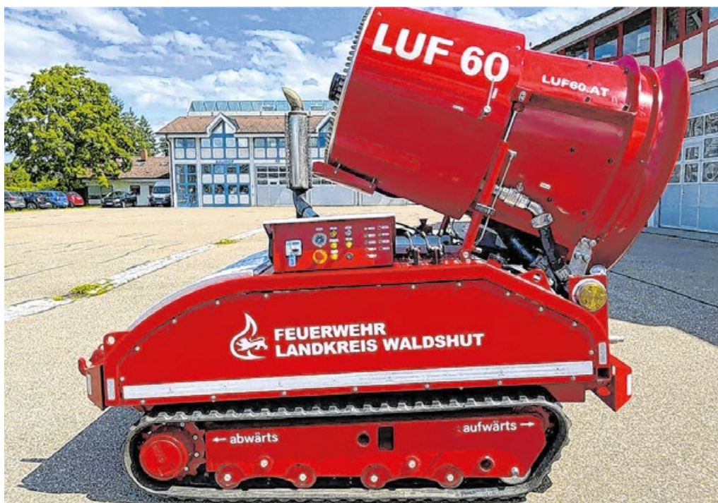
Schon bald soll ein Löschroboter LUF 60, wie dieser des Landkreises Waldshut, auch im Landkreis Schwäbisch Hall zur Verfügung stehen.

Es gibt des Weiteren einzelne Posten, die zu 100 Prozent vom Landkreis Schwäbisch Hall finanziert werden. So etwa die Persönliche Schutzausrüstung oder die „leichte Variante“ der Einsatzkleidung, die bei der Bekämpfung von Vegetationsbränden zum Einsatz kommt. Über-