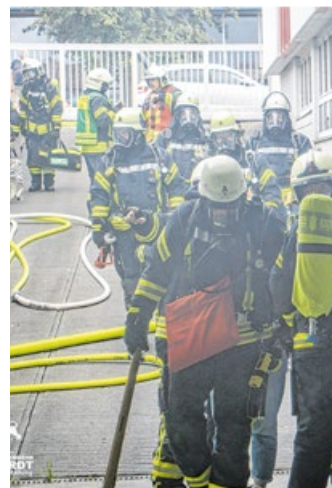
Mehr als 100 Einsatzkräfte trainierten gemeinsam den Ernstfall.

Besonders zu schaffen machte den Mainhardter Feuerwehrleuten ein schwerer Verkehrsunfall Anfang April: Ein Fahrzeuglenker kam mit seinem Pkw von der Straße ab, prallte gegen mehrere Bäume und wurde eingeklemmt. Er musste von den Einsatzkräften mit hydraulischem Rettungsgerät aus dem deformierten Unfallwagen gerettet werden. Der Verletzte wurde vom Rettungsdienst in ein Krankenhaus gebracht. Neben der technischen Rettung sicherten die Einsatzkräfte die Unfallstelle ab und stellten den Brandschutz sicher. Für die Bergung des Unfallfahrzeuges wurde zudem ein Abschleppunternehmen hinzugezogen.