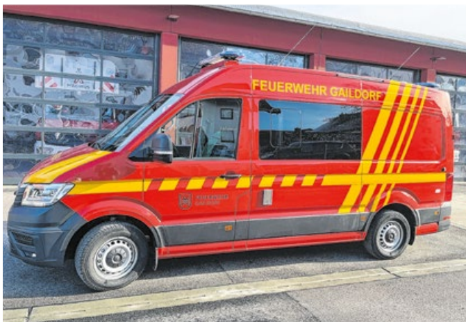
Der ELW rückt bei nahezu jedem Einsatz als erstes Fahrzeug aus.

Im Rahmen der Gaildorer Kirche Anfang November bekamen die Kameraden ihren neuen Einsatzleitwagen (ELW) überreicht. Das neue Fahrzeug ist mit hochmoderner Technik ausgestattet. So ist es möglich, mehrere unterstellte Einheiten zu führen und zielgerecht einzusetzen. Es