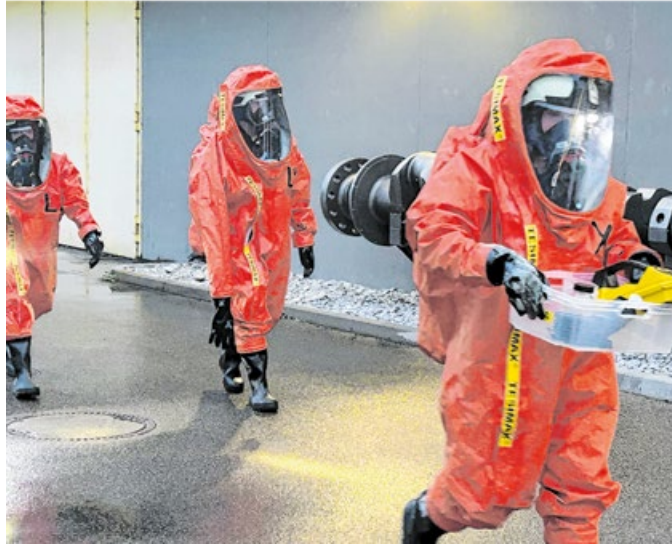
Gefährliche Salzsäure: Bei einem Einsatz in einem Kraftwerk waren die Spezialisten des Gefahrgutzuges gefordert.