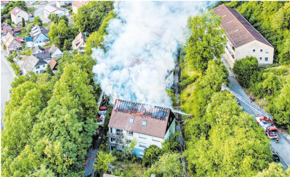
Im Juli brannte ein leerstehendes Gebäude an der Kocherhalde beim Diak. Die Einsatzkräfte hatten das Feuer schnell unter Kontrolle.