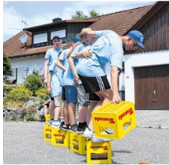
Spielerischer Teamgeist steht bei den Aufgaben im Fokus.

„Nach den schwierigen Pandemie Jahren ist es uns gelungen, die Kinder und Jugendlichen wieder zu motivieren. Noch nie waren so viele Teilnehmende mit dabei. Das zeigt zugleich auch die enorme Bindung der