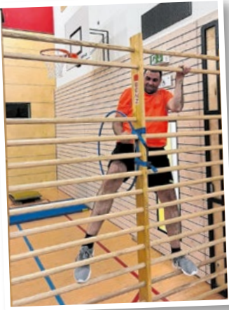
Beim Hallensport steht unter anderem ein Stationenlauf auf dem Programm.