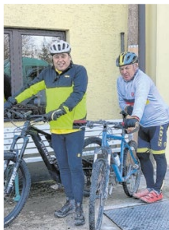
Einige der Kameraden halten sich bei gemeinsamen Radausfahrten fit.

Zwei Stunden in der Woche trainieren die einzelnen Gruppierungen. „Es ist einfach wichtig, dass Feuerwehrleute fit sind, denn bei einem Atemschutzeinsatz im Brandfall gehen schon