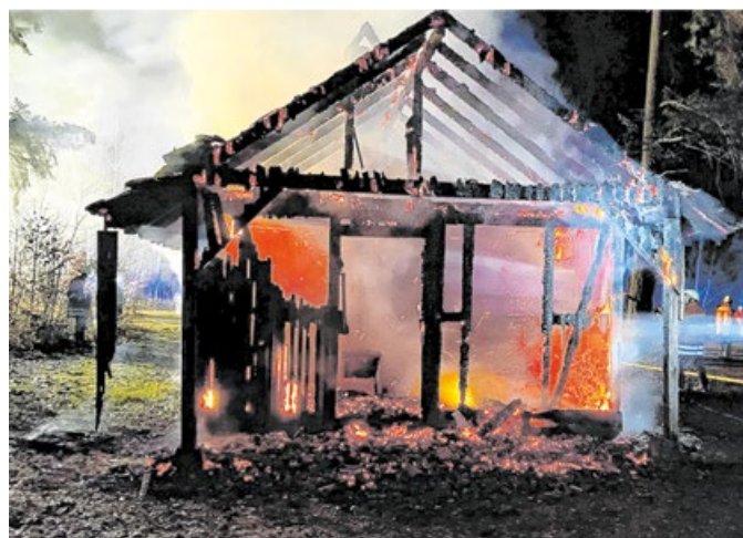
Im März brannte die Wasserlochhütte an der Brünstraße.

Einen weiteren Einsatz gab es im Oktober, als die Feuerwehrkameraden zu einem Schmelbrand in einem Zimmer im Obergeschoss eines Hauses gerufen wurden. Die Bewohnerin hatte den Brand bemerkt, weil der Rauchmelder Alarm schlug. Die Feuerwehr war mit drei Fahrzeugen und 30 Wehrleuten im Einsatz und verhinderte, dass das Feuer auf das Gebäude übergriff.