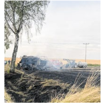
Der Flächenbrand in Niederwinden war besonders herausfordernd.

fang Juli in Niederwinden blieb im Gedächtnis. Ein etwa sechs Hektar großes Feld inklusive Strohballen und -presse standen in Flammen. Nur mithilfe der ortsansässigen Landwirte konnte ein Übergreifen auf die benachbarten Wohnhäuser und angrenzenden Felder verhindert werden. Die Feuerwehr war mit über 50 Einsatzkräften und sechs Fahrzeugen mehrere Stunden im Einsatz. Die ohnehin schon hohen Temperaturen und die Hitze des Brandes waren eine zusätzliche Belastung. Die anhaltenden Trockenzeiten begünstigen Flächen sowie Waldbrände immer mehr. „Gerade hier zeigt sich, wie wichtig die Zusammenarbeit und die Hilfsbereitschaft der Landwirte ist“, so der Kommandant.