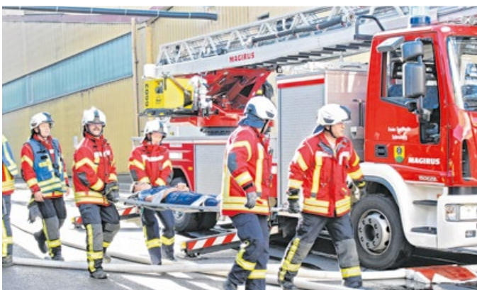
Bei der Übung wurde auch eine Person gerettet.

Freiwillige Feuerwehr Blaufelden Ein Werkstattbrand und eine Personenrettung standen bei der Hauptübung auf dem Programm. Dazu wurde eine Wasserversorgung aufgebaut.