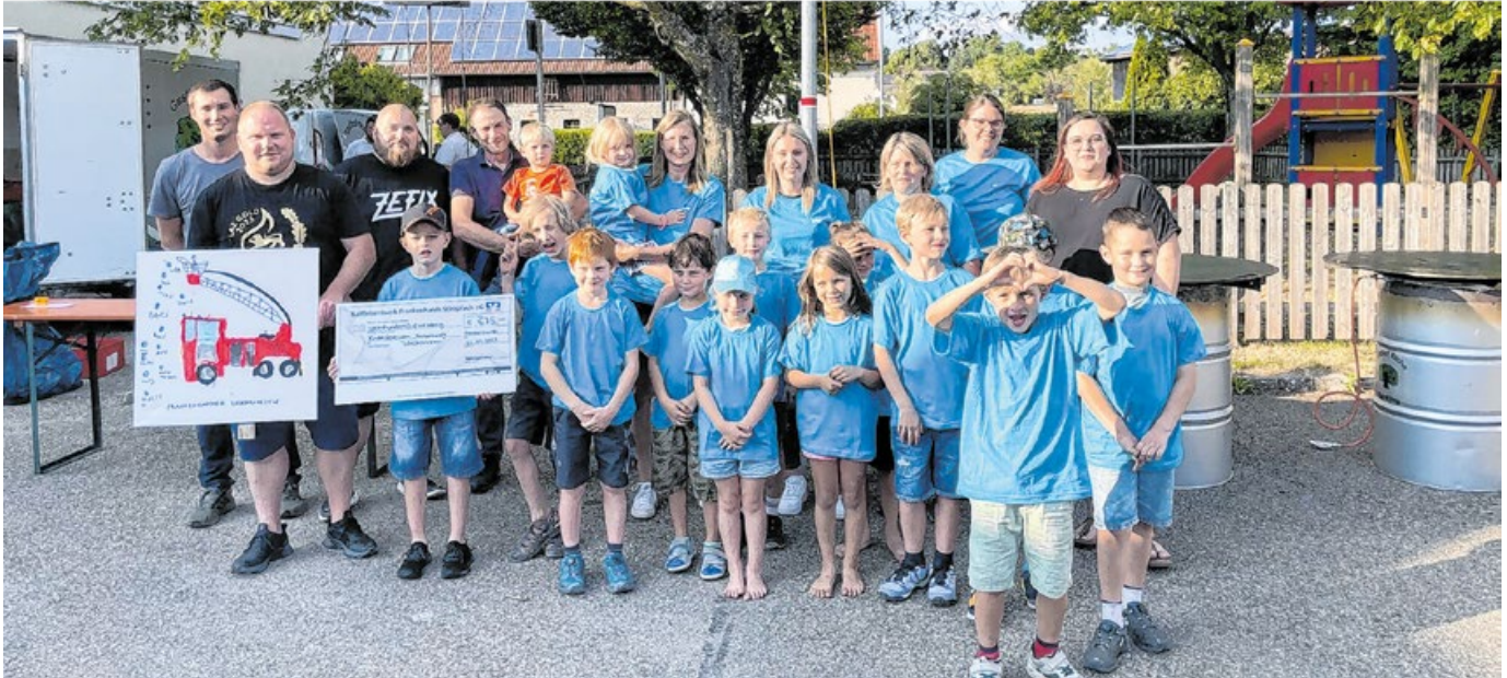
Basteln, malen und Feuerwehrauto fahren: 2022 wurde die Kinderfeuerwehr gegründet, bei der Spaß im Vordergrund steht.