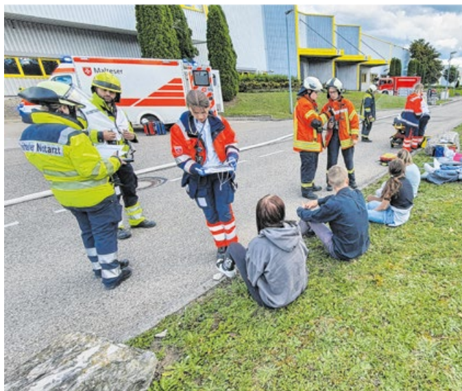
Das Werk Bühlertal von Kärcher war Schauplatz für eine Großübung mit rund 100 Einsatzkräften.

Außerhalb des Gebäudes waren zahlreiche Feuerwehrleute zum Beispiel mit dem Bereitstellen der Wasserversorgung beschäftigt. Hierzu wurden unter anderem über 2000 Meter Schlauch verlegt und über mehrere Pumpen das Löschwasser zu den Löschfahrzeugen befördert. Zwölf „vermisste“ Personen wurden innerhalb kurzer