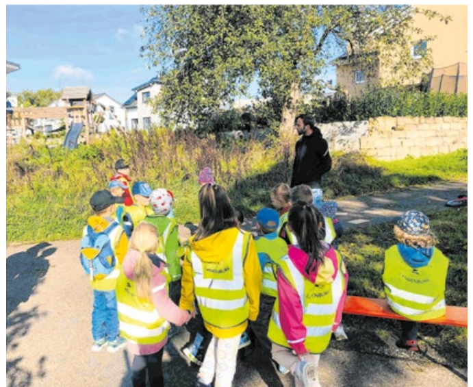
Kinderfeuerwehr-Challenge: An zehn abwechslungsreichen Stationen konnten rund 100 Kinder ihr Können unter Beweis stellen.