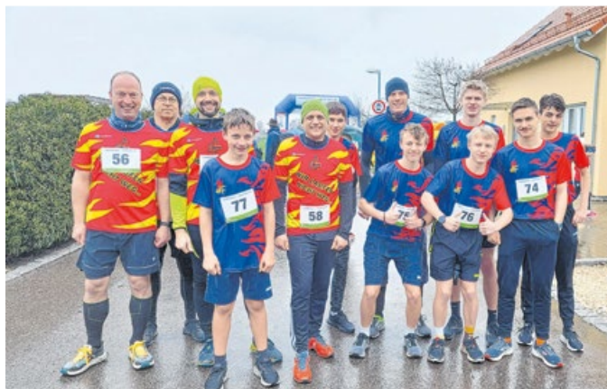
Junge und ältere Kameraden halten sich mit Laufen fit.

„Gerade bei der Feuerwehr wird oft körperliche Höchstleistung ohne Aufwärmen gefordert. Hier macht sich eine gewisse Grundfitness durchaus positiv bemerkbar“, erklärt Gottlieb