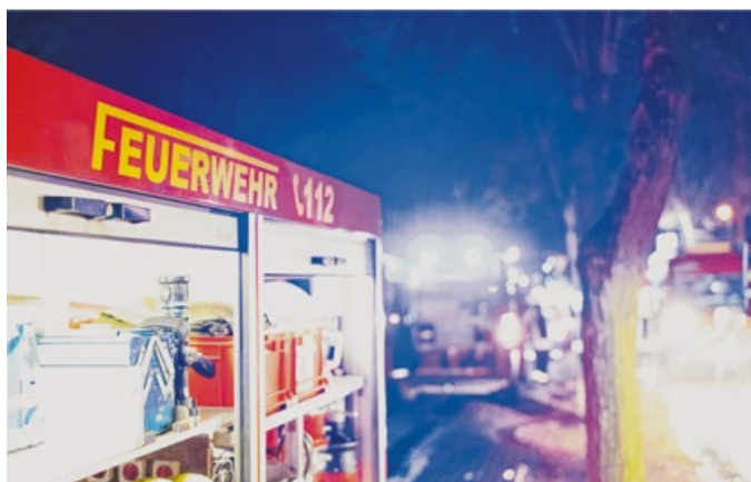
Auch bei Verkehrsunfällen ist die Feuerwehr im Einsatz.

mit den Baumaßnahmen ergeben. Aber die Feuerwehr Crailsheim will auch diese Herausforderungen meistern, schreibt sie in ihrem Jahresbericht.