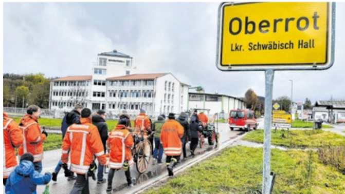
Symbolischer Akt: Eine Gruppe Feuerwehrangehöriger läuft mit ihren Familien von Hausen nach Oberrot.

Der Großbrand in Ebersberg im Juli 2023 dürfte der bisher größte Einsatz der Feuerwehr Oberrot auf dem Gemeindegebiet gewesen sein. Mit drei Drehleitern aus Gaildorf, Murrhardt und Schwäbisch Hall musste gegen das verheerende Feuer vorgegangen werden. Insgesamt waren rund 100 Feuerwehrleute mit 25 Fahrzeugen im Einsatz. Beim Eintreffen der ersten Wehren