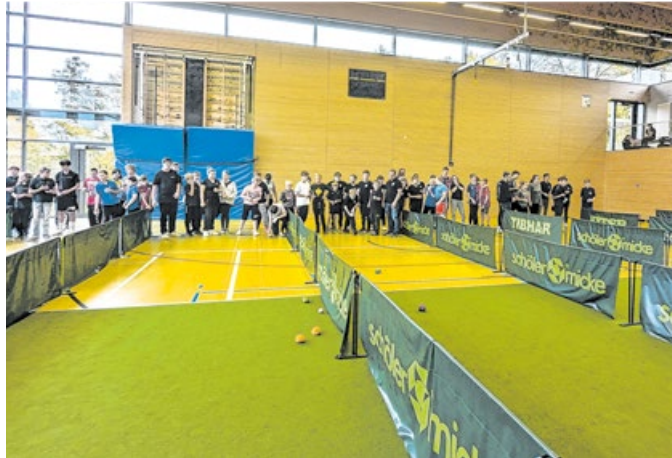
26 Mannschaften von 15 Jugendfeuerwehren kamen zum Walter-Klenk-Pokalturnier nach Michelfeld.

Bei der gewählten Disziplin Soft Boccia geht es darum, dass die Mannschaften ihre Bälle so nah wie möglich an der Zielkugel platzieren müssen, um möglichst viele Punkte zu sammeln. Gegen Nachmittag standen sich im Finale Michelfeld 3 und Mainhardt 1 gegenüber. Mainhardt konnte sich ganz knapp behaupten und wird dadurch das nächste Walter-Klenk-Pokalturnier ausrichten.