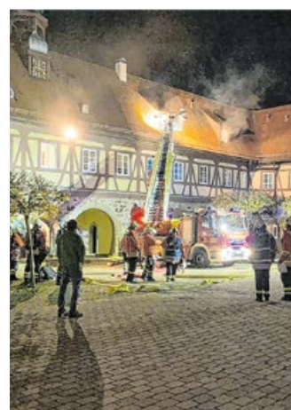
Im Schloss in Michelbach fand erneut eine große Räumungsübung statt.