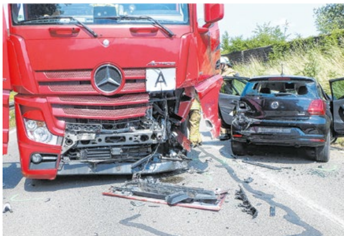
Im Juni wurde die Feuerwehr Fichtenberg zu einem schweren Verkehrsunfall gerufen.