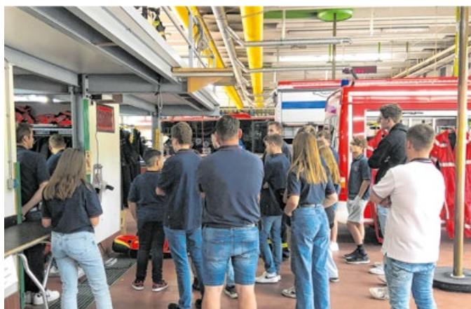
Die Jugendfeuerwehr machte im vergangenen Jahr einen Ausflug zur Berufsfeuerwehr nach Augsburg.

Als Dankeschön und Belohnung für die tatkräftige Hilfe bei der Einweihung des Magazins im Jahr 2022, wurde der Jugendfeuerwehr ein großes Geschenk gemacht. Sie brachen im Herbst zu einem Ausflug nach Augsburg auf, wo die Kinder und Jugendlichen zunächst eine interessante Führung bei der Berufsfeuerwehr bestaunten. Im Anschluss ging es zur „Feuerwehrelbniswelt“ mit Anschauungsmaterial und Aktivitäten. Vom Rauchmel-