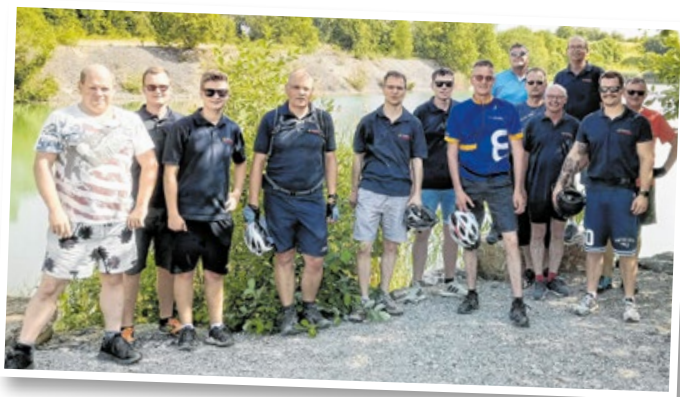
Die „Feuerwehrlflurer“ machten sich bei ihrer Ausfahrt am See im ehemaligen Steinbruch bei Schmalfelden ein Bild von den Gegebenheiten vor Ort.

2023 nutzten die Radler das Einweihungsfest der Feuerwehrkameraden der Abteilung Schrozberg-West und kehrten nach einem Bogen im Westen des Gemeindegebiets im neuen Feuerwehrhaus in Bartenstein zum Mittagessen ein. Auch an diesem Tag wurden die Löschwasserbehälter der dortigen Weiler inspiziert. Und als Besonderheit machten sich die Radfahrer auch mit dem unter der Bundesstraße 290 verlegten Leerrohr vertraut, durch das bei einem Brand Löschwasser aus einem See auf die gegenüberliegende