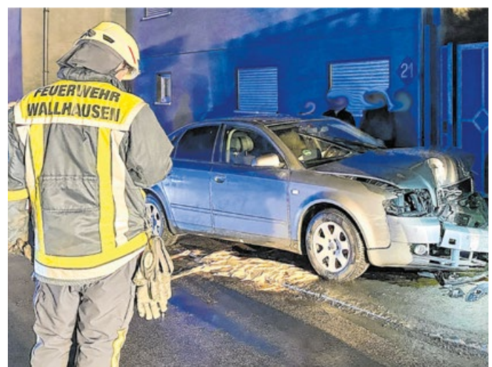
13 Mal musste die Wehr ausrücken – darunter auch zu Unfällen.