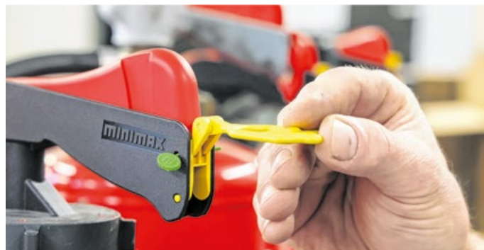
Bei unbenutzten Feuerlöschern ist die Plombe noch intakt.

schlossenen Räumen kann so die CO 2 -Konzentration stark ansteigen und es droht Atemnot und Ersticken-gefahr.