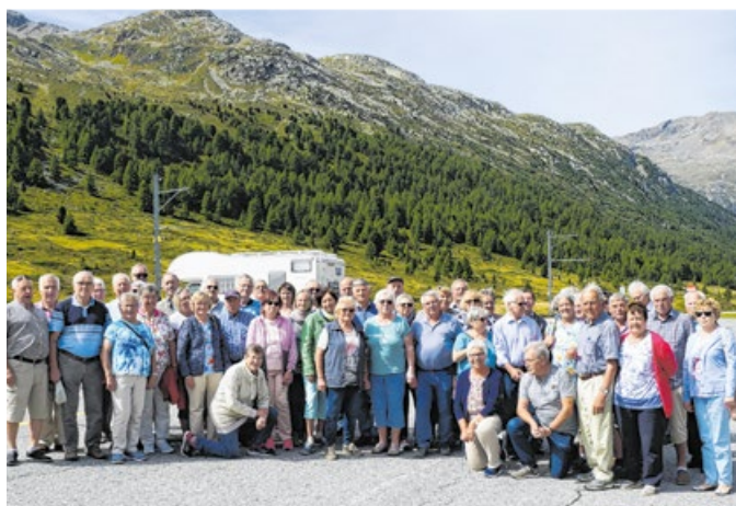
Anfang September starteten 53 Personen zur Ausfahrt.

Im Juni fand dann das Kreis-seniorentreffen in Schrozberg statt, erstmals unter der Leitung des neuen Obmanns. 150 Kameraden waren mit Begleitung anwesend und erfreuten sich am Programm, das die aktiven Kameraden und die Senioren der Feuerwehr Schrozberg zusammen mit ihren Alterskameraden aus Schrozberg zusammengestellt hatten. Neben der Vorstellung der Stadt Schrozberg, dem Einsatzbereich von Stadtbrand-