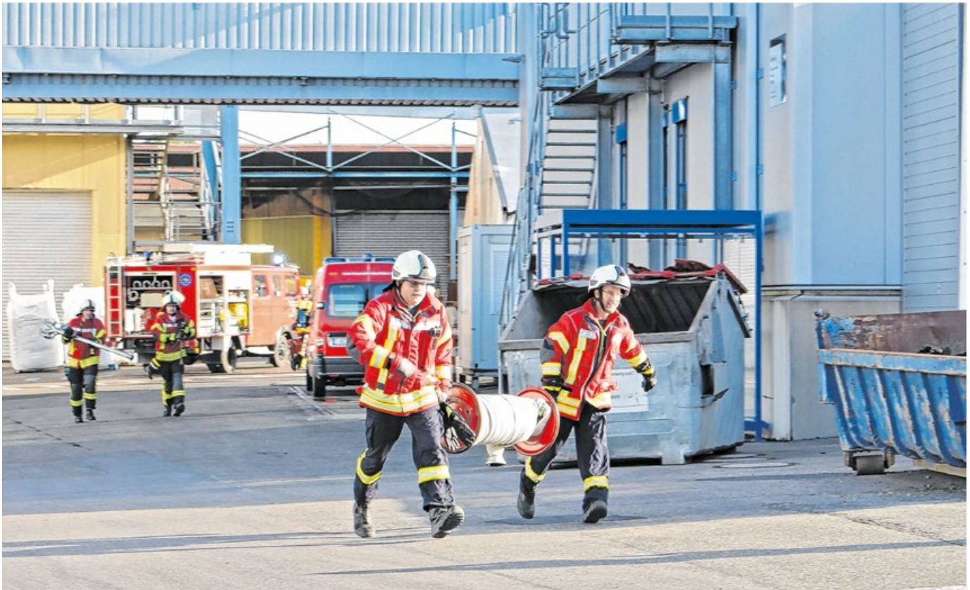
Die Feuerwehr Blaufelden führte ihre Hauptübung auf dem Gelände der Firma Bosch Tiernahrung durch.