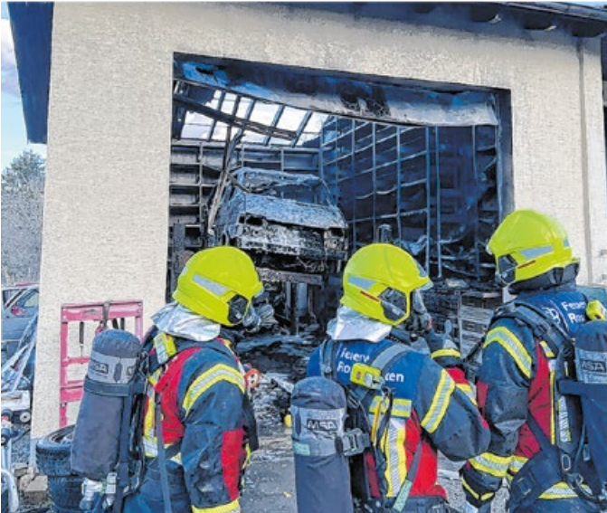
Im März brach in einer kleinen Kfz-Werkstatt in Sanzenbach ein Feuer aus. Die Feuerwehr rückte mit 40 Kräften an.

Freiwillige Feuerwehr Rosengarten Tag der offenen Tür, Ferienzeltlager und Oktoberfest: Die Wehr blickt auf erfolgreiche Veranstaltungen zurück.