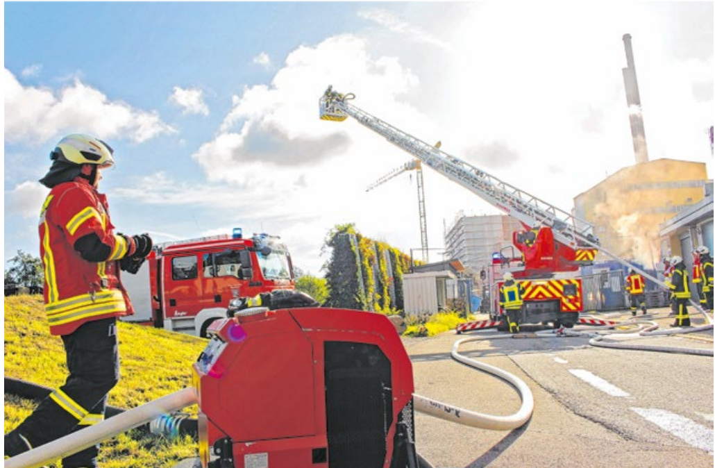
Mit dem aus dem Drehleiterkorb abgegebenen Löschwasser wurden Gebäude gelöscht, die nicht vom angenommenen Brand betroffen waren.

Die Feuerwehr Blaufelden bedankt sich an dieser Stelle bei der Firma Bosch Tiernahrung für die Bereitstellung des Geländes für die Übung.