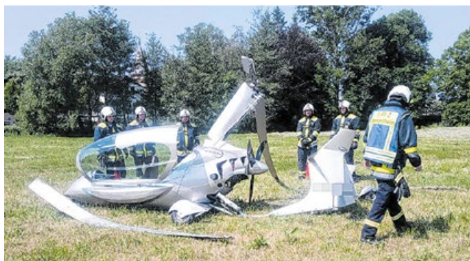
Ein Gyrocopter musste in Mittelfischach notgelandet werden, die beiden Insassen wurden nur leicht verletzt.

Zu einem ungewöhnlichen und echten Einsatz eilten die Kameradinnen und Kameraden vergangenes Jahr nach Mittelfischach: Glück im Unglück hatten zwei Insassen eines Gyrocopters, also einem speziellen Tragschrauber, die im Obersontheimer Teilort notlandeten mussten – sie wurden nur leicht verletzt. Die Einsatzkräfte kümmerten sich um den Brandschutz und um auslaufende Flüssigkeiten.