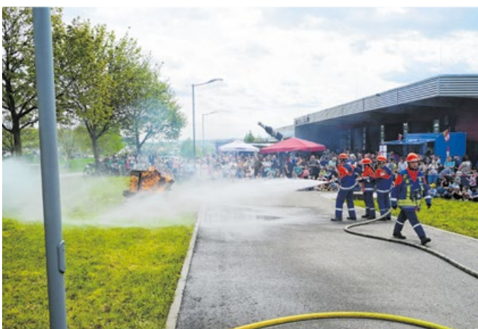
Die Jugendfeuerwehr Vellberg konnte 2023 ihr 30-jähriges Bestehen feiern. Bei einer Schauübung im Rahmen des Feuerwehrfestes zeigte der Nachwuchs sein Können.